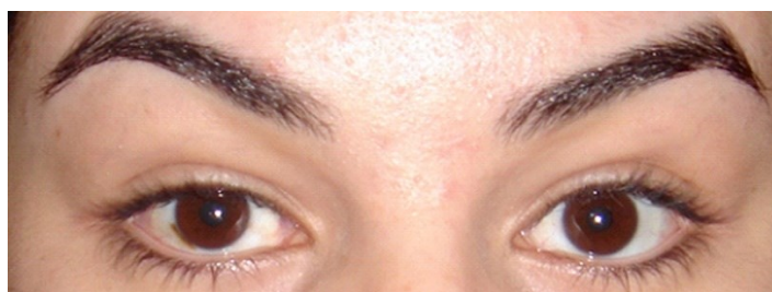
Figura 4 - Ortotropia 6 meses após a cirurgia.

Realizado em 13/05/2014 retrocesso dos músculos retos mediais em ambos os olhos, associado à ressecção do músculo reto lateral em olho direito, com ortotropia imediata mantendo-se assim até a última consulta (Figura 4).