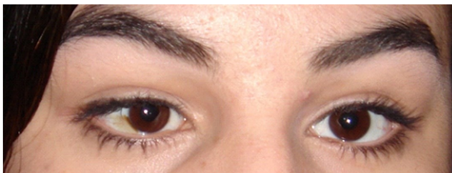
Figura 1 - Desvio ocular pré-operatório.