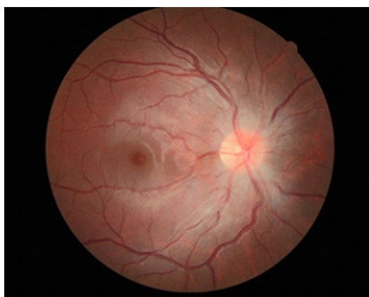
Figura 2 - Retinografia colorida OD apresentando edema de papila em fase de regressão, 22 dias após o início do quadro mostrando ainda edema de fibras nervosas especialmente na região nasal de nervo óptico.

Após 22 dias de evolução, realizou-se retinografia colorida em AO que apresentou edema de papila em fase de regressão (Figura 2 e 3).